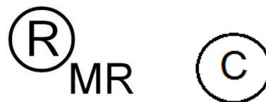
Fig. 1. Logotipos de marca registrada

notoriedad o fama de marcas, emitir declaratorias de protección a denominaciones de origen, autorizar el uso de las mismas; la publicación de nombres comerciales, así como la inscripción de sus renovaciones, transmisiones o licencias de uso y explotación, y las demás que le otorga esta Ley y su reglamento, para el reconocimiento y conservación de los derechos de propiedad industrial.